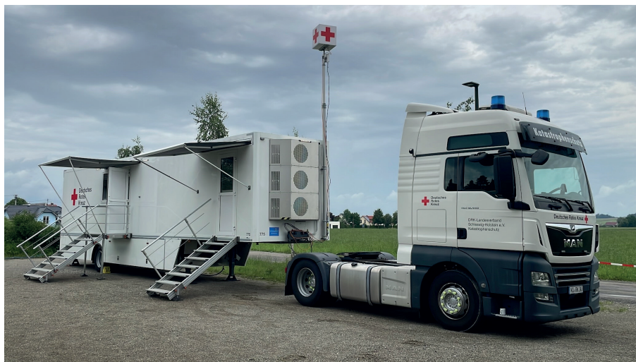
So sieht die mobile Praxis des DRK Schleswig-Holstein aus, mit der der Ausfall einer Hausarztpraxis in Bayern überbrückt wurde.

Das DRK spricht von einer „vollwertigen, mobilen Arztpraxis“, die im Bedarfsfall autonom arbeiten soll. Nach Erreichen eines Standorts braucht es nur wenige Stunden, bis die Praxis einsatzbereit ist. Dafür müssen u.a. Strom- und Wasserleitungen angeschlossen werden. Ab zwölften Juni konnte in der mobilen Praxis behandelt werden, an diesem Standort war sie für eine Einsatzzeit von mindestens einer Woche vorgesehen. Schleswig-Holstein ist einer von vier Landesverbänden in Deutschland, die eine solche mobile Praxis für Katastrophenfälle vorhalten. Das Generalsekretariat des DRK fordert die