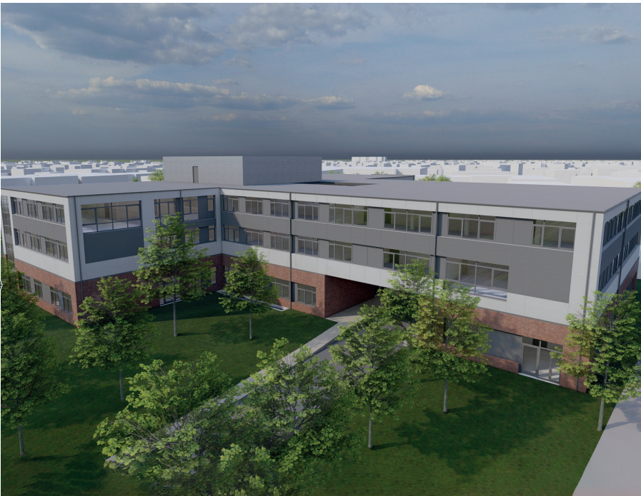
So soll die neue Psychiatrie am WKK Heide aussehen. Fertig werden soll der Neubau Ende 2026.